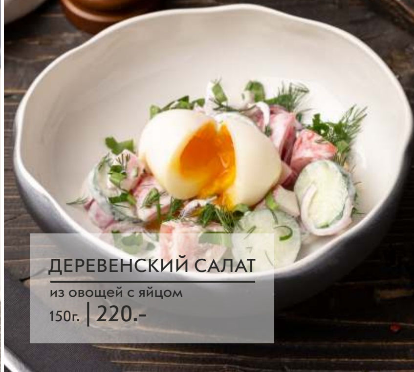
ДЕРЕВЕНСКИЙ САЛАТ из овощей с яйцом 150г. | 220.-