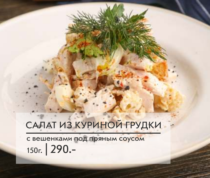
САЛАТ ИЗ КУРИНОЙ ГРУДКИ с вешенками под пряным соусом 150г. | 290.-