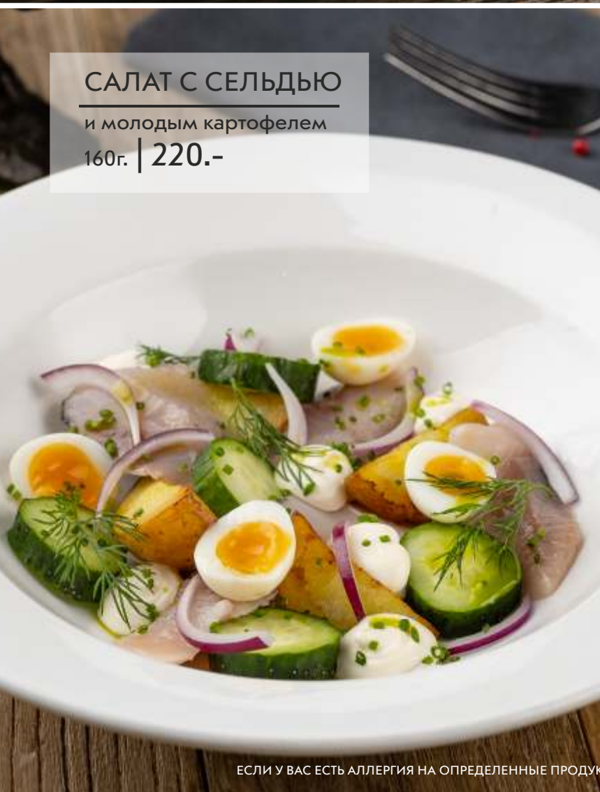
САЛАТ С СЕЛЬДЬЮ и молодым картофелем 160г. | 220.-