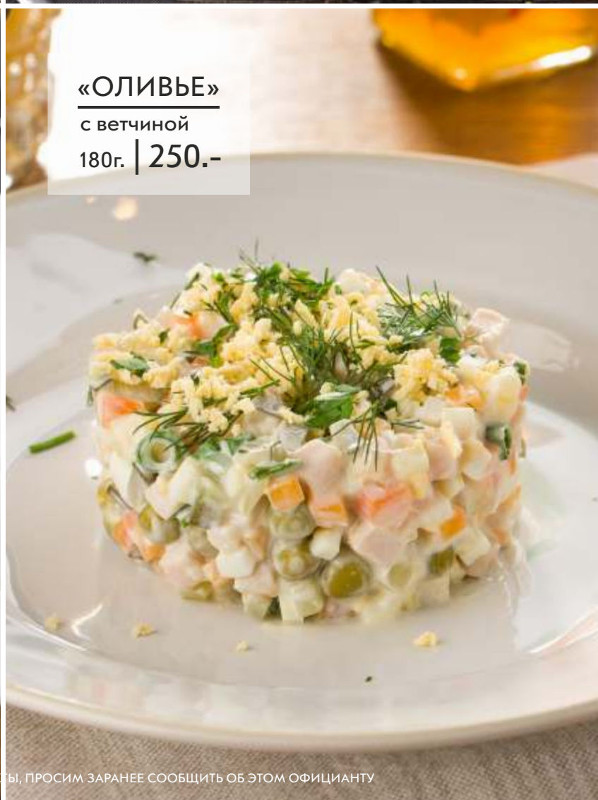
«ОЛИВЬЕ» с ветчиной 180г. | 250.-